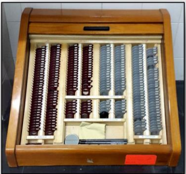
* جعبه لنز