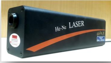
* ليزر هليوم نئون