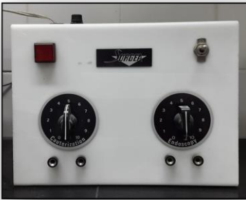
* الکتروکوتر SURGEA