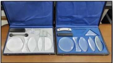
* مجموعه دیوپتر، منشور و عدسی های همگرا و واگرا