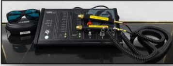
* ليزر ۸۱۰ و ۶۶۰ نانومتر