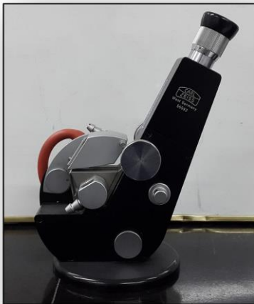
* رفراکتوم آبه